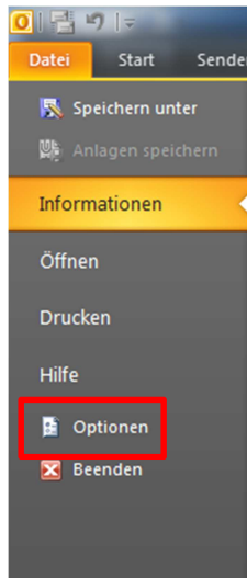
Abbildung 2: Menü